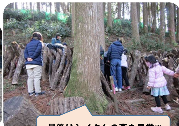
最後はシイタケの森を見学♡