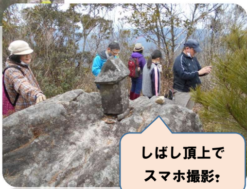
しばし頂上で スマホ撮影: