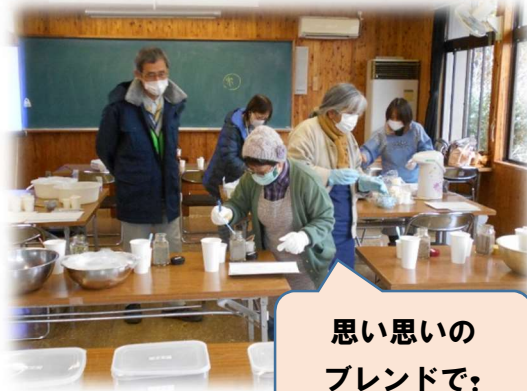
思い思いの ブレンドで: