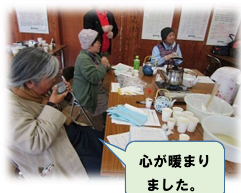
心が暖まり ました。