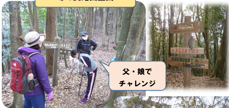
父・娘で チャレンジ