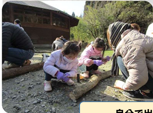
自分で出来ました!